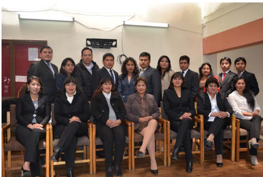
Equipo de trabajo del Tribunal Electoral Departamental de Potosí

A través del cual se pretende visibilizar las actividades programadas y ejecutadas durante la gestión 2016 según el POA y POE, cuenta además con la información complementaria en forma detallada el trabajo de cada área funcional que en definitiva contribuyó al logro del Plan Estratégico Institucional.