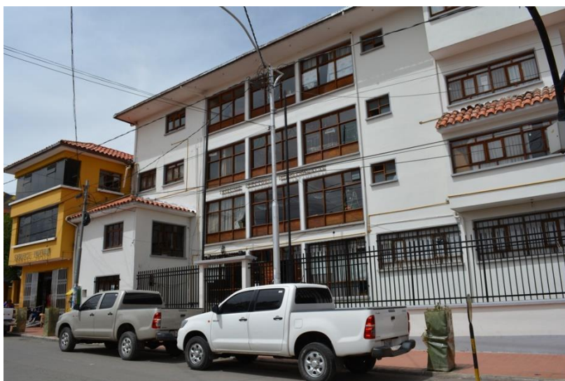
Tribunal Electoral Departamental de Potosí

A través del cual se pretende visibilizar las actividades programadas y ejecutadas durante la gestión 2017 según el POA y POE, cuenta además con la información complementaria en forma detallada del trabajo de cada área funcional que en definitiva contribuyó al logro del Plan Estratégico Institucional.