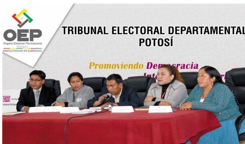
Sala Plena TRIBUNAL ELECTORAL DEPARTAMENTAL DE POTOSÍ

El presente documento corresponde al informe final de la gestión 2017, por parte del Tribunal Electoral Departamental de Potosí, en el que refleja la consolidación de la función electoral conforme a las atribuciones asignadas en la Ley 018, bajo la administración del Tribunal Supremo Electoral.